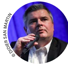
Par Anthony Rey Journaliste de l'édition Occitanie Le Journal des Entreprises